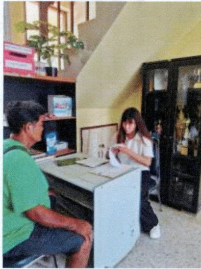
๑.๑ การรับชำระนอกสถานที่